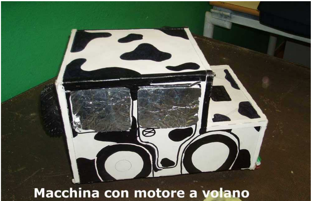
Macchina con motore a volano