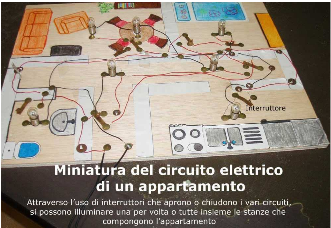
Miniatura del circuito elettrico di un appartamento

Attraverso l'uso di interruttori che aprono o chiudono i vari circuiti, si possono illuminare una per volta o tutte insieme le stanze che compongono l'appartamento